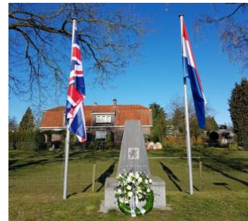
Kranslegging bij Somerset oorlogsmonument

Na het echeq van de operatie Market Garden, waarbij de geallieerde oversteek van de Rijn bij Arnhem in september 1944 mislukte, waren de geallieerden in het vroege voorjaar van 1945 vanuit het bevrijde zuiden richting Duitse grens opgeschoven. Op 24 maart staken de geallieerden bij Wesel de Rijn over om daarna vanuit Emmerik de Achterhoek binnen te vallen. Dorp voor dorp trokken de bevrijders vanaf 28 maart onze regio in. Op 31 maart waren Winterswijk, Groenlo en Aalten al bevrijd. Terwijl daar de vlaggen uitgingen, mochten even later de inwoners van onder meer Vorden, Ruurlo, Hengelo, Vierakker en Wichmond aan de vrijheid ruiken. Op Tweede Paasdag sloten de Canadezen door bij Almen, waar ze een bruggenhoofd over het Twentekanaal aanlegden. De Duitsers boden heftige weerstand en het komt tot gevechten ter hoogte van Harfsen en Laren. In de buurt van het Larense station slaan de Duitsers de Canadezen zelfs terug. Tientallen boerderijen in de omgeving van Almen en Harfsen gingen verloren. Lochem en Barchem zijn inmiddels bevrijd en vierden feest.