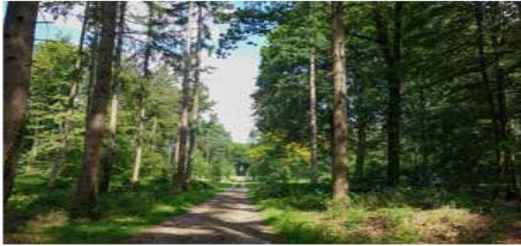
Versterken van laanstructuren en ondergroei