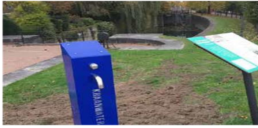
Watertappunt en informatiebord langs de wandelroute